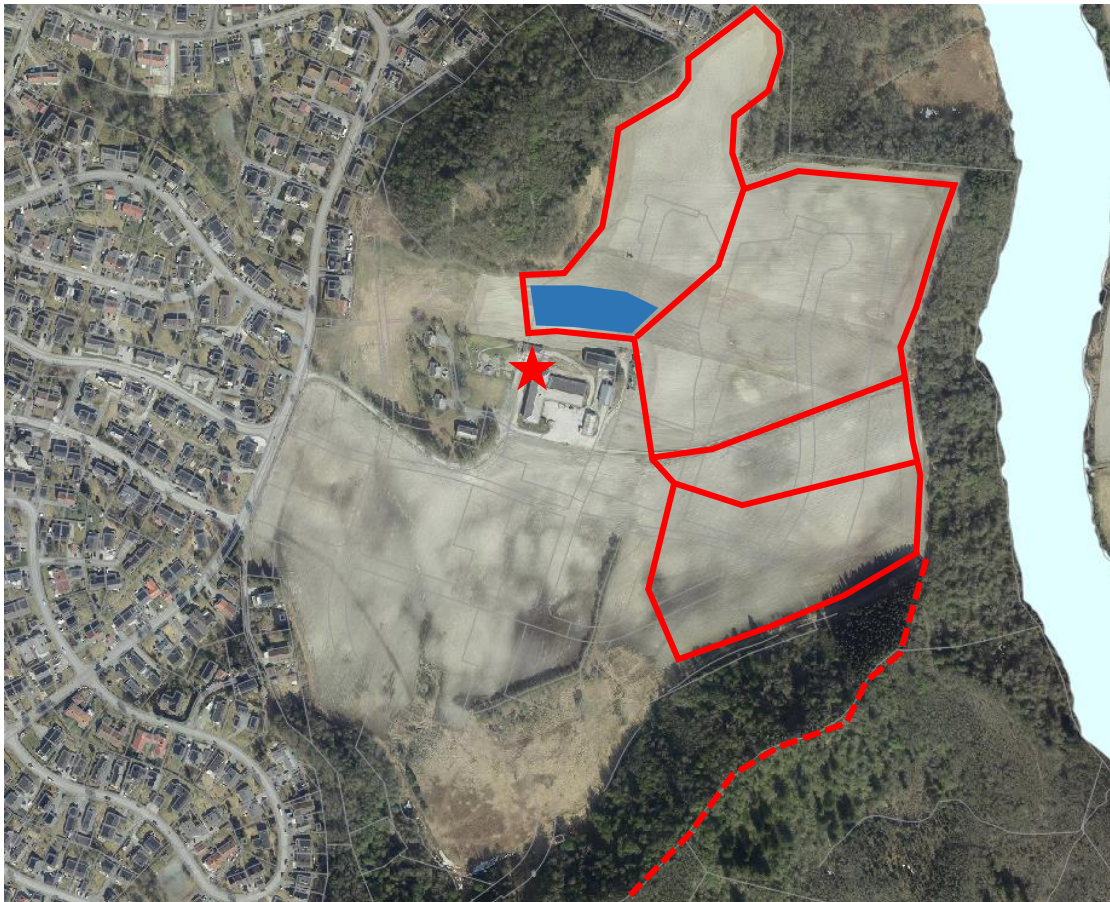
Figur 3. Skiløype inntegnet med rødt. Område til skileik vises med blå. Stiplet linje viser forbindelse sørover mot Tiller, og rød stjerne viser Sjetne IL sine klubblokaler ved poengrenn.

For den inneværende vinteren vil det fortsatt være et skitilbud på jordet. Skiløypa vil gå i samme trasé som i dag mot nord og øst (langs Nidelvkorridoren), men med en kortere rundløype. Start- og mål vil være ved selve Hallsteingården. Den midlertidige skiløypa vil få lys, som styres av idrettslaget. Når det arrangeres poengrenn vil Sjetne IL benytte lokalene til Geno, som ligger i tilknytning til fjøset (rød stjerne).